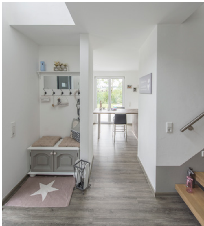
Kernstück des Hauses ist der geräumige Flur, in dem eine frei schwebende Treppe nach oben führt.